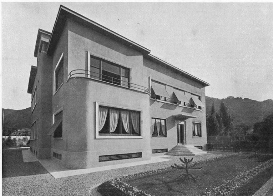
FACCIATA VERSO LA VIA 27 MAG- GIO.