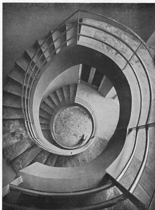
ING. GABRIELE GIUSSANI. - CASA GATTI IN COMO. - LA SCALA VISTA DALL'ALTO.

L'edificio è costruito in cemento armato e mattoni; gli intonaci sono tinteggiati in Silexore; gli impianti di riscaldamento sono autonomi; ogni appartamento è provvisto di acqua calda centrale e di forza motrice.